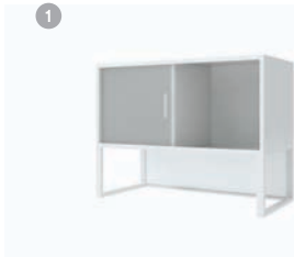
데스크 스토리지 1. THD-800CR 800 x 368 x 430 2. THD-800DR 800 x 368 x 600