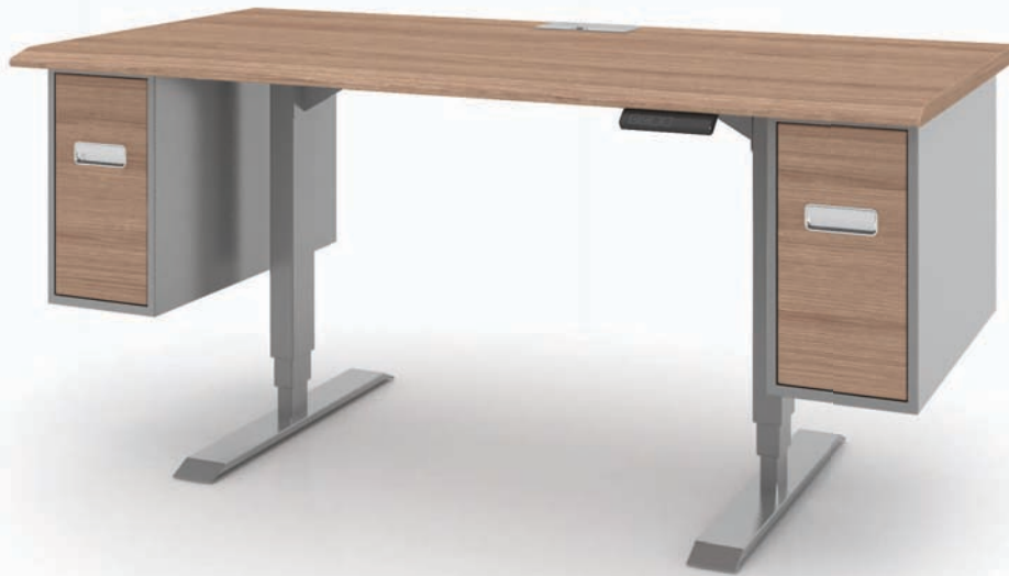
1. Comfort-bass 1600 x 800

높낮이가 조절되는 Comfort 시리즈는 사용자의 인체에 맞도록 상판의 높이 조절이 가능하기 때문에 업무를 보다 효율적이고 편안하게 할 수 있는 장점이 있는 데스크입니다.