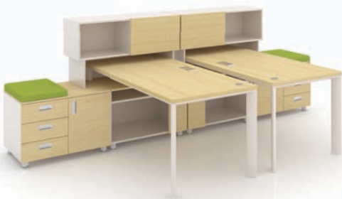
· SU-I + 하부수납장 + 데스크 스토리지