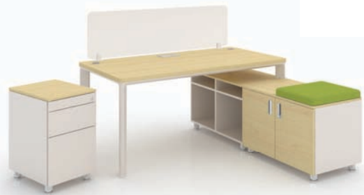
· SU-II + 하부수납장 + 서랍 + 데스크스크린