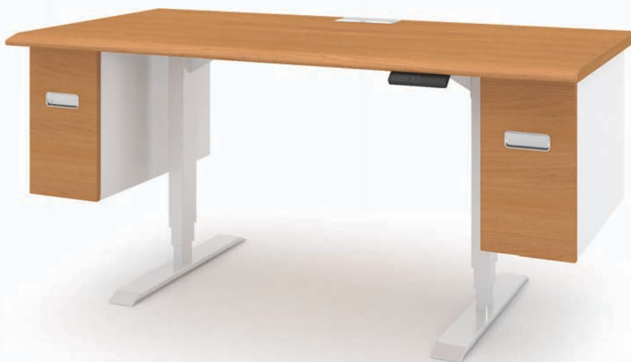
2. Comfort-lite 1600 x 800