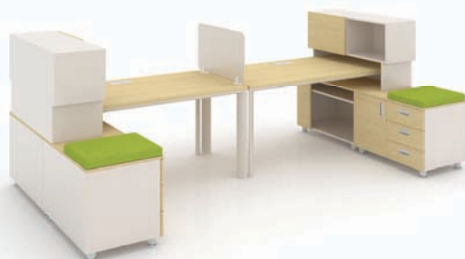
· SU-I + 하부수납장 + 데스크 스토리지 + 데스크 스크린