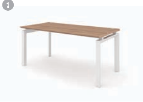
DESK 1. MY-I 1400/1600/1800 x 800 x 720