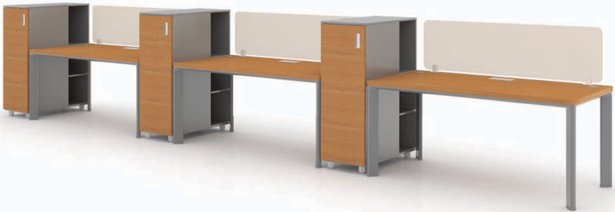
· SU-II + 슈퍼사이드 수납장 + 데스크 스토리지 + 데스크 스크린

Super-Side 시리즈는 책상 옆에 붙는 사이드 수납장 시리즈로써 작업자의 편의에 따라 여러 종류의 사이드 수납장을 선택할 수 있습니다. 별도의 구성품 없이 하나의 가구만으로도 역할에 충실하기 때문에 협소한 공간에서도 유용하게 이용하실 수 있습니다.