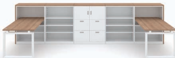
· MY-II + 사이드 수납장 (THD-800ER + THD-800ER2 + THD-800ER3 + THD-800FR)