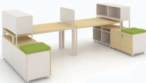
· SU-II + 하부수납장 + 서랍 + 데스크스크린