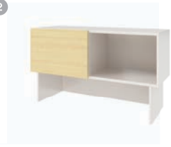
데스크 스토리지 1. MSD-1150AR 1150 x 370 x 600 2. MSD-1150AL 1150 x 370 x 600