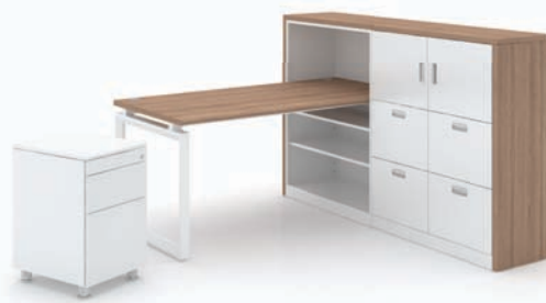
· MY-II + 서랍 + 사이드 수납장 (THD-800ER + THD-800FR)