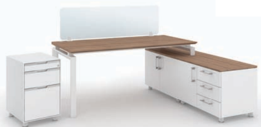
· MY-I + 하부수납장 + 서랍 + 데스크스크린