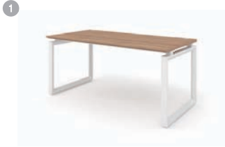
DESK 1. MY-II 1400/1600/1800 x 800 x 720