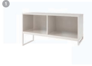
데스크 스토리지 1. MSD-1150BR 1150 x 370 x 600 2. MSD-1150BL 1150 x 370 x 600