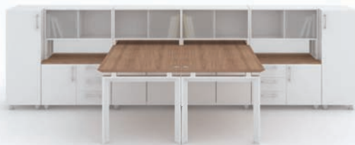
· MY-I + 하부수납장 + 옷장 + 데스크 스토리지