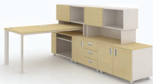
· SU-I + 하부수납장 + 데스크 스토리지