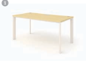
DESK 1. SU-I 1400/1600/1800 x 800 x 720