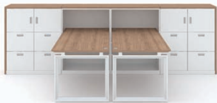
· MY-II + 사이드 수납장 (THD-800ER + THD-800ER2 + THD-800FR)