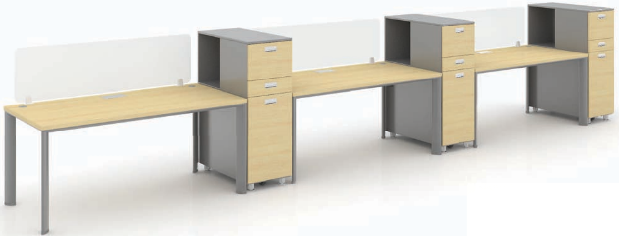
· SU-I + 슈퍼사이드 수납장 + 데스크 스토리지 + 데스크 스크린