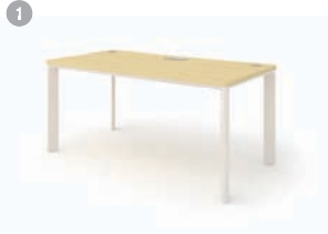
DESK 1. SU-II 1400/1600/1800 x 800 x 720