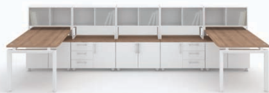
· MY-I + 하부수납장 + 데스크 스토리지