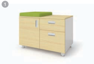
하부수납장 1. MSD-800DR 800 x 500 x 550 2. MSD-800ER 800 x 500 x 550