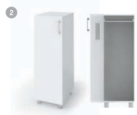
1. THD-400A 400 x 500 x 1150 1. THD-400B 400 x 500 x 1150