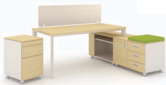
· SU-I + 하부수납장 + 서랍 + 데스크 스토리지 + 데스크 스크린