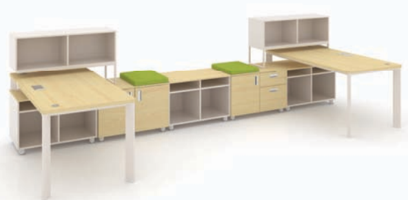
· SU-II + 하부수납장 + 서랍 + 데스크스크린