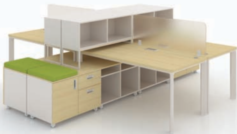
· SU-II + 하부수납장 + 서랍 + 데스크스크린