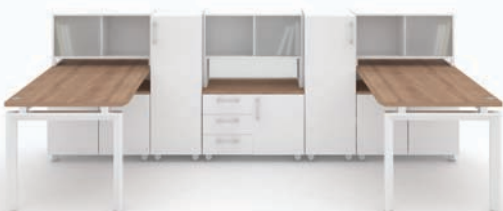
· MY-I + 하부수납장 + 옷장 + 데스크 스토리지