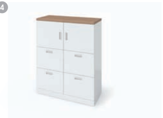
사이드 수납장 1. THD-800ER 870 x 400 x 1150 2. THD-800ER2 870 x 400 x 1150 3. THD-800ER3 840 x 400 x 1150 4. THD-800FR 840 x 400 x 1150