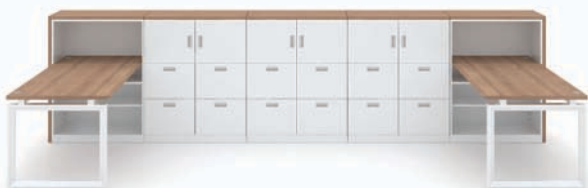
· MY-II + 사이드 수납장 (THD-800ER + THD-800ER2 + THD-800FR)