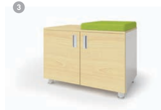
3. MSD-800FL 800 x 500 x 550