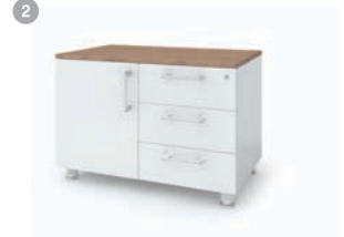
1. THD-800A 800 x 500 x 550 2. THD-800BR 800 x 500 x 550